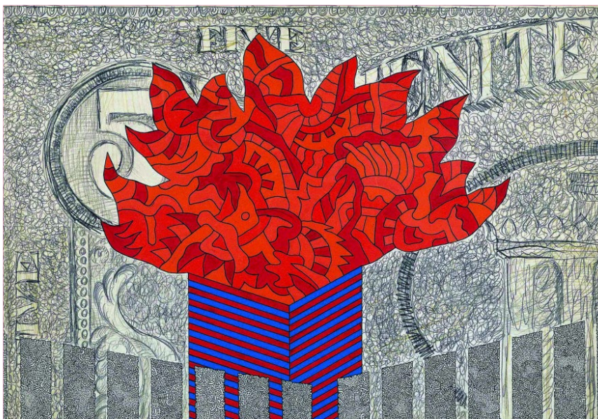
Αλέξης Ακριθάκης, 5 Dollar Bill, 1969

Τα «τσίκι-τσίκι» έργα δημιουργήθηκαν συστηματικά από τα μέσα