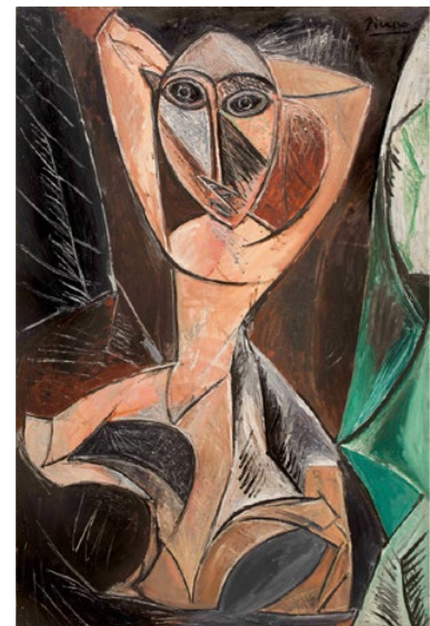
Pablo Picasso - Femme nue aux bras levés, 1907. Λάδι σε καμβά.

Μουσείο Σύγχρονης Τέχνης του Ιδρύματος Βασίλη & Ελίζας Γουλανδρή, Ερατοσθένους 13, Παγκράτι Τηλ. 210-72.52.895