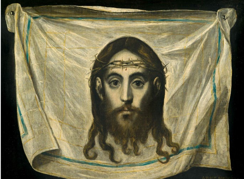
Δομήνικος Θεοτοκόπουλος (El Greco) - Η Θεία Μορφή. Αρχές δεκαετίας 1580.

Το νέο διαμάντι της Αθήνας δεν είναι άλλο από το νέο Μουσείο Σύγχρονης Τέχνης του Ιδρύματος Βασίλη και Ελίζας Γουλανδρή. Το μεσοπολεμικό οίκημα της οδού Ερατοσθένους ανακαινίστηκε υποδειγματικά, αποκτώντας επιπλέον για σύντροφο ένα νέο πολυώροφο κτήριο, προκειμένου να μπορεί να καλύψει τις σύγχρονες μουσειολογικές ανάγκες. Πριν λίγες μέρες άνοιξε για να δείξει στο κοινό την αμύθητη συλλογή του φιλότεχνου ζεύγους και έκανε την Αθήνα να παραμιλά. Όλα μέσα και έξω από αυτό επιβεβαιώνουν ότι η αναμονή άξιζε-ας μην ξεχνάμε πόσα χρόνια έχουν μεσολαβήσει από το 1992 που έγινε η πρόταση ίδρυσης του μουσείου και πόσες θέσεις έχει αλλάξει ξεκινώντας από Ρηγίλλης, περνώντας στο πάρκο Ριζάρη και καταλήγοντας το 2009 στη σημερινή τοποθεσία, στο Παγκράτι.