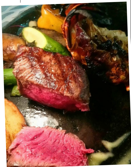
Η surf n' turf πρόταση

Mythos by Divani, Τηλ. 210-89.11.100 Αγίου Νικολάου 10, Βουλιαγμένη